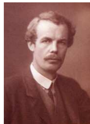
Arthur Cecil Pigou

Els tres ingredients "incitadors al delictes" (publicitat, crèdit i obsolescència planificada) es poden considerar com a externalitats negatives de la societat del creixement.